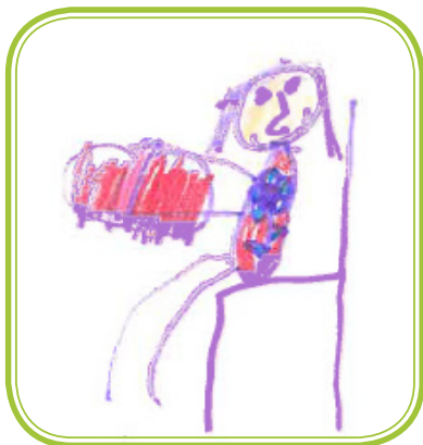
LEPO RAVNAMO S KNJIGO

Zvezek »Koraki v vrtcu« otroka spremlja od vstopa v vrtec do odhoda iz njega in vsebuje vtise, izdelke, »spomine«, pomembne korake na tej poti.