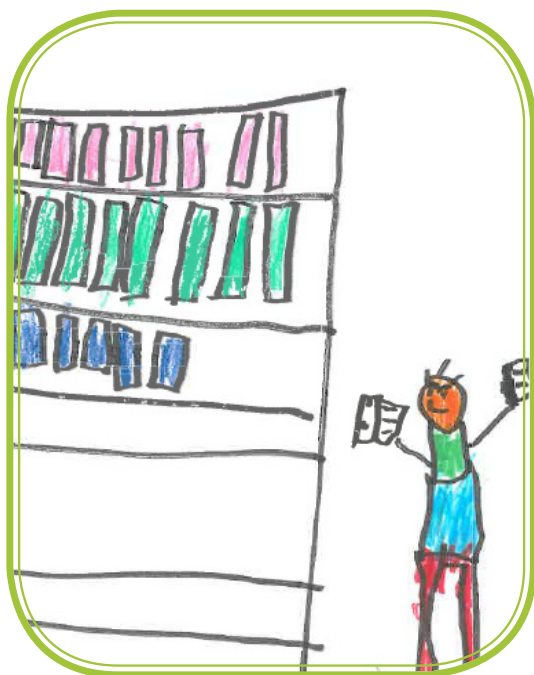
SKRBIMO ZA RED