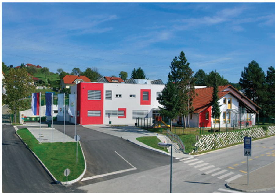
CENTRALNA ENOTA VOJNIK