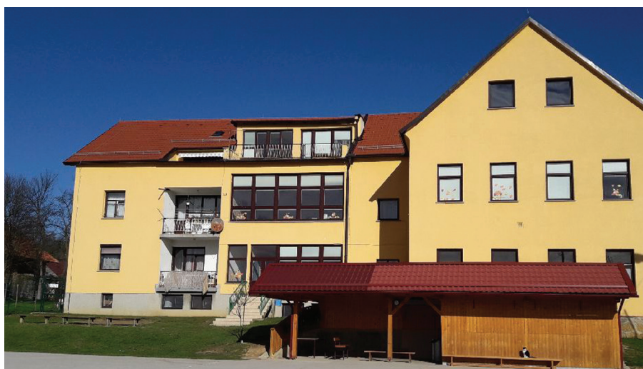
ENOTA ŠMARTNO V ROŽNI DOLINI