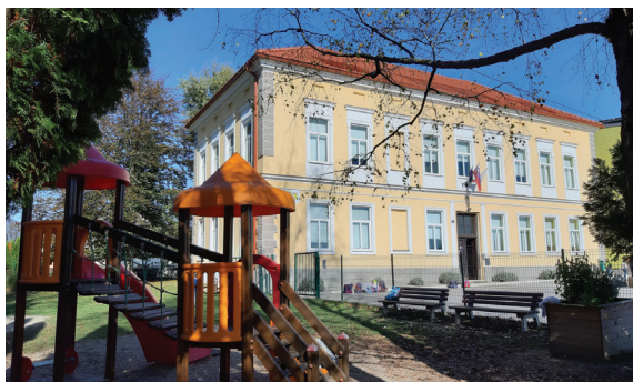
ENOTA NOVA CERKEV